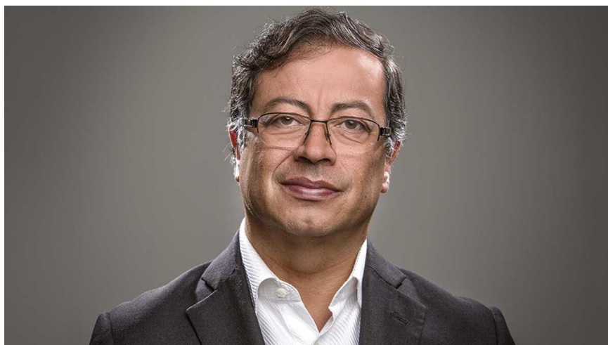
H.S. GUSTAVO PETRO URREGO