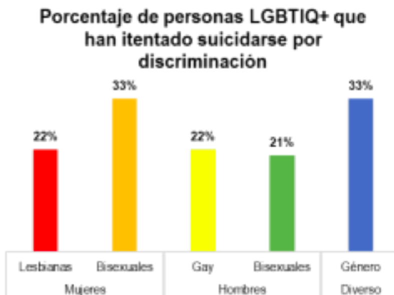
Gráfica 3.

En octubre de 2021 el medio de comunicación RCN Radio dio a conocer el testimonio de una persona homosexual que fue sometida a una mal llamada terapia de conversión en una nota denominada “Testimonios sobre terapias de conversión” y las prácticas que vulneran los derechos de personas LGBTQ 17 . Allí se dio a conocer que “cada terapia de conversión” es decir, cada ECOSIEG, tiene unas características particulares y se publicó un testimonio en el cual la víctima afirma haber asistido a reuniones en donde lo hacían orar con el fin de abandonar su orientación sexual diversa.