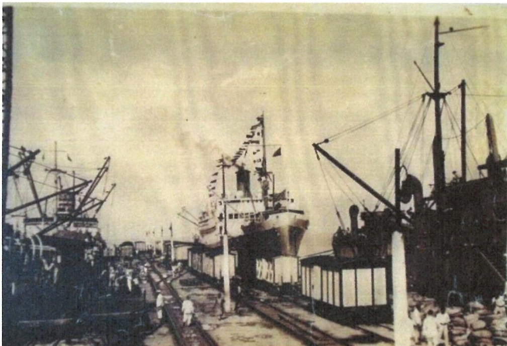
Imagen 4: Puerto de Puerto Colombia